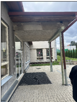
SBB03 VSTUPNÍ DVEŘE PRO OSSP Z VENKOVNÍHO PROSTORU DO HALY 1NP