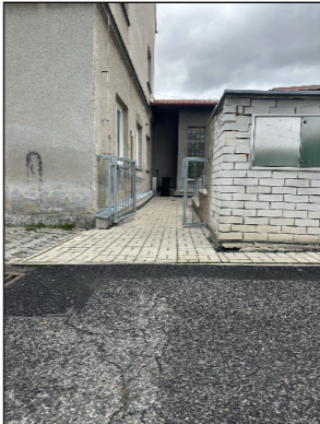
SBB01 VSTUP DO AREÁLU ŠKOLY PRO OSSP Z ŽIŽKOVY ULICE