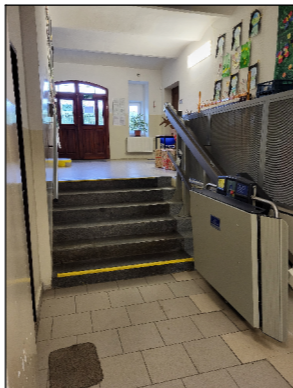
SBB05 SKLOPNÁ ZVEDACÍ PLOŠINA PRO TRANSPORT INVALIDNÍHO VOZÍKU NA VYROVNÁVACÍM SCHODIŠTI