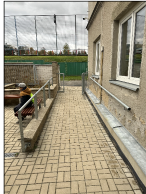
SBB02 VYROVNÁVACÍ RAMPA VSTUPU PRO OSSP ZE ŽIŽKOVY ULICE