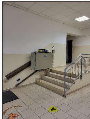
SBB04 SKLOPNÁ ZVEDACÍ PLOŠINA PRO TRANSPORT INVALIDNÍHO VOZÍKU NA VYROVNÁVACÍM SCHODIŠTI