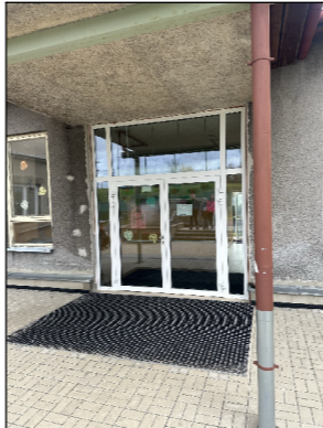
SBB03 VSTUPNÍ DVEŘE PRO OSSP Z VENKOVNÍHO PROSTORU DO HALY 1NP V RAMCI BEZBARIÉROVÝCH ÚPRAV BUDE NEZBYTNĚ DOPLNIT PROSKLENĚ VÝPLNĚ DVEŘNÍCH KŘÍDEL ZABRAMÁNÍ DO V. 400mm PROTI NAJETÍ INV. VOZÍKU DO SKEL